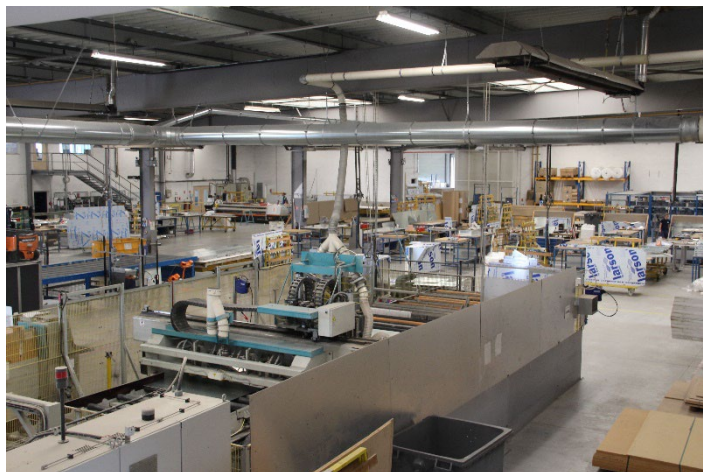
À Cholet, Tim Composites dispose désormais d'une usine de 6.000 m 2 .

Depuis janvier 2023, la société s'est agrandie en passant de 3 500m 2 à 6 000 m 2 . Elle a pris possession de l'intégralité de son bâtiment historique profitant du départ d'une autre société du Groupe qui a fait construire son propre bâtiment à proximité. Avec cette extension, TIM Composites a pu augmenter sa capacité industrielle et réorganiser les flux de production afin de gagner en productivité.