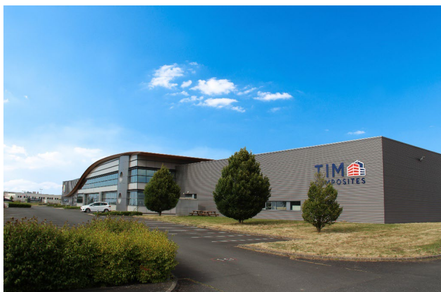
Site de Cholet et siège social de TIM Composites.

Doté d'un savoir-faire de plus de 25 ans, TIM Composites façonne les panneaux en aluminium composite pour habiller les architectures les plus audacieuses. Depuis 2020, l'entreprise a ajouté une nouvelle corde à son arc : l'aluminium massif grâce à sa fusion avec l'entreprise SAB FCB située à Sainte-Luce-sur-Loire. Industriel en mouvement, TIM Composites investit pour l'avenir en se modernisant afin de répondre aux besoins de ses clients et aux nouveaux enjeux de notre société.